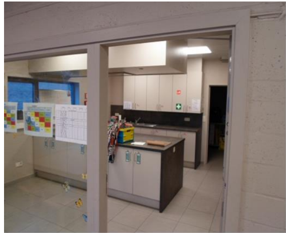
Sportpark Moerkensheide: in het EHBO-lokaal in de spelerstunnel